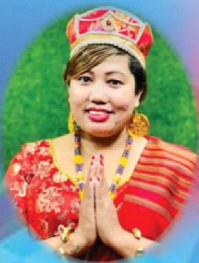
राधिका हमाल गायिका