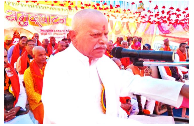
सबै धर्मको सम्मान आवश्यक छ : पूर्व राष्ट्रपति यादव पेज २ मा

वर्ष ७ अंक ७५ २०८० साल मंसिर १४ गते विहिवार 30 Nov 2023 पृष्ठ ४ (क,ख) मूल्य रु. ५ www.shirishnews.com