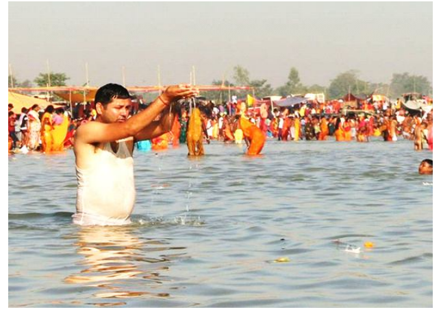
कमला नदिमा लाखौं भक्तजनले गरे कार्तिक स्नान । पेज ३ मा

वर्ष ७ अंक ७३ २०८० साल मंसिर १२ गते मंगलवार 28 Nov 2023 पृष्ठ ४ मूल्य रु. ५ www.shirishnews.com