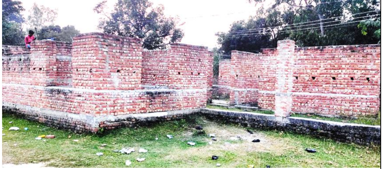
नगराइन नगरपालिकाको जटहीमा अवस्थित भारतीय लगानीमा निर्माण हुन लागेको विद्यालय भवन अलपत्र अवस्थामा।