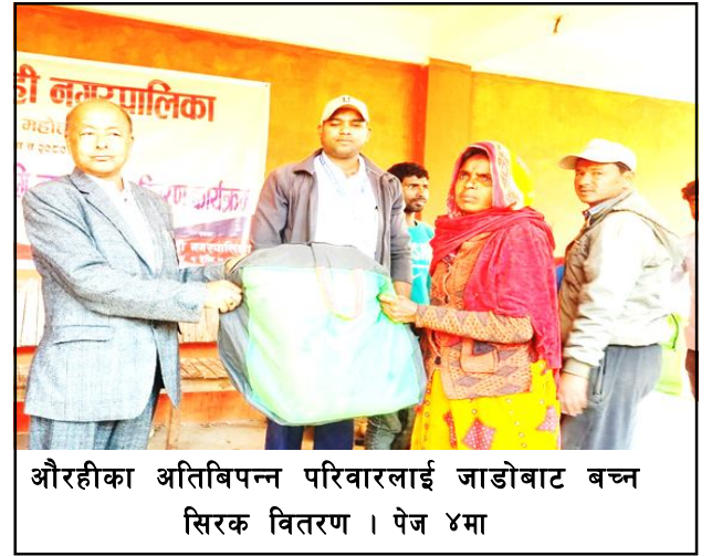
औरहीका अतिबिपन्न परिवारलाई जाडोबाट बच्न सिरक वितरण । पेज ४मा

वर्ष ७ अंक १०१ २०८० साल पुस ११ गते बुधवार 27 Dec 2023 पृष्ठ ४ मूल्य रु. ५ www.shirishnews.com