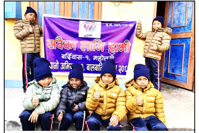
सबैका लागि हामी संस्थाको आयोजनामा न्यायो अभियान -२ शुभारम्भ । पेज २ मा

वर्ष ७ अंक १०३ २०८० साल पुस १३ गते शुक्रवार 29 Dec 2023 पृष्ठ ४ मूल्य रु. ५ www.shirishnews.com