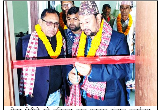
मेयर क्षेत्रीले गरे बर्दिबास नगर पत्रकार संजाल कार्यालय उदघाटन । पेज ४ मा

वर्ष ७ अंक १०४ २०८० साल पुस १४ गते शनिवार 30 Dec 2023 पृष्ठ ४ मूल्य रु. ५ www.shirishnews.com