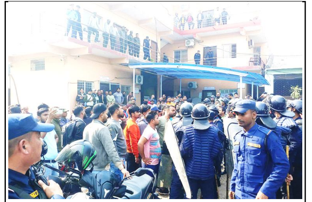
वीरगंज महानगरका प्रमुख र उपप्रमुख पक्षका समर्थकबीच विवाद । पेज ४ मा

वर्ष ७ अंक ८८ २०८० साल मंसिर २७ गते बुधवार 13 Dec 2023 पृष्ठ ४ मूल्य रु. ५ www.shirishnews.com