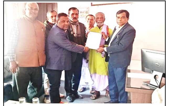
मालपोत कार्यालय स्थापनाको लागि क्षीरेश्वरनाथका मेयर यादव द्वारा विभिन्न निकायलाई पत्राचार । पेज ४ मा

वर्ष ७ अंक ८९ २०८० साल मंसिर २८ गते विहवार 14 Dec 2023 पृष्ठ ४ मूल्य रु. ५ www.shirishnews.com