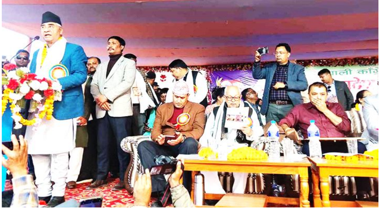
प्रणाली रहे सम्म कुनै पनि सम्भावना नरहेको बताए । देउवाले भने, 'अहिले कांग्रेस ठूलो पार्टी भए जस्तै भोलिका दिनमा बनाउने अभियान मधेश प्रदेश अन्तर्घात नगरी ठूलो पार्टी बाटै सुरु गर्नु आवश्यक छ ।'

अभियान चलाएर मुक्त बनाउनु पर्ने बताए । देउवाले अहिले कांग्रेस ठूलो राजनीतिक दल रहेको र भविष्यमा पनि बहुमत प्राप्त गर्ने रूपमा स्थापित गर्न नेता कार्यकर्तालाई आग्रह गरे । उनले नेपालको राजनीतिलाई सुदृढीकरण गर्न कांग्रेसले काम गरिरहेको बताए । सभापति देउवाले आगामी दिनमा कांग्रेसको एकल सरकार बनाउन सक्नुपर्ने बताए । देउवाले नेपालको राजनीति सुदृढ गर्दै लैजानुपर्ने बताए । उनले नेपाली राजनीतिलाई बलियो बनाउन कांग्रेसले अभियान चालि सकेको बताए । उनले देशमा मिश्रित निर्वाचन