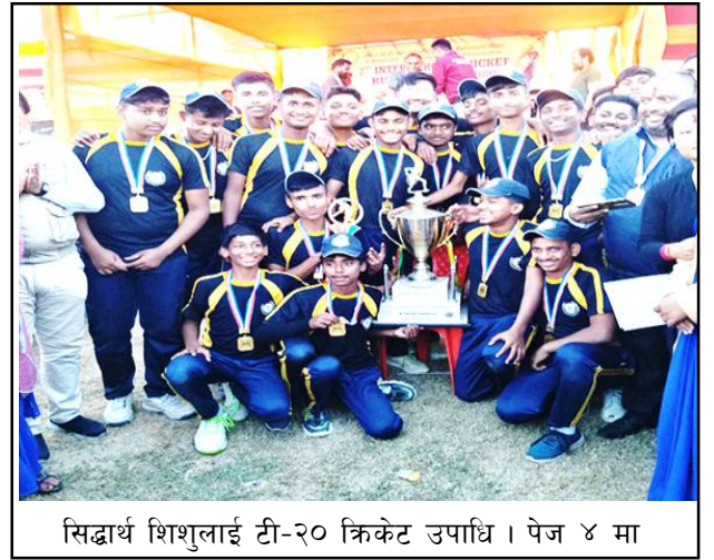
सिद्धार्थ शिशुलाई टी-२० क्रिकेट उपाधि । पेज ४ मा