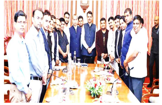
नेपाली क्रिकेटलाई सहयोग गर्न तयार -महाराष्ट्रका उपमुख्यमन्त्री पेज रमा

वर्ष ७ अंक ७६ २०८० साल मंसिर १५ गते शुक्रवार 1 Dec 2023 पृष्ठ ४ मूल्य रु. ५ www.shirishnews.com