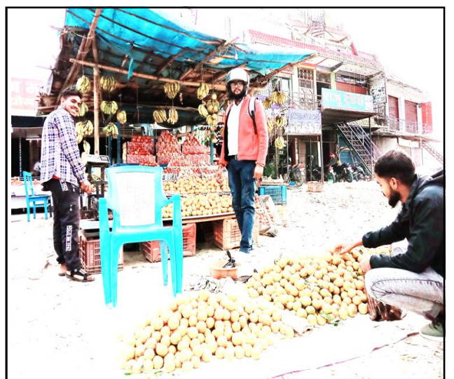
पूर्वपश्चिम राजमार्गको जक्सन धनुषाको मिथिला नगरपालिकाको ढल्केबर चौकमा सुन्तला बेच्दै एक फलफूल व्यवसायी र खरिद गर्दै यात्रु ।