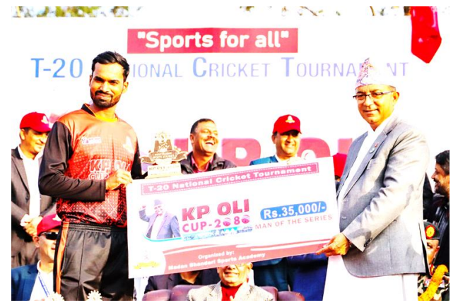
आर्मीलाई हराउँदै मधेसले जित्यो केपी ओली कपको उपाधि । पेज २ मा