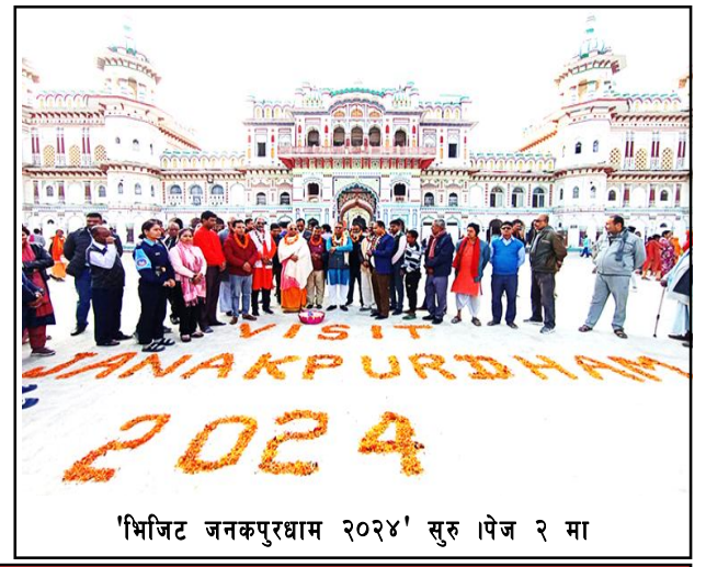
'भिजिट जनकपुरधाम २०२४' सुरु भए २ मा

वर्ष ७ अंक १०५ २०८० साल पुस २० गते शुक्रवार 5 Jan 2024 पृष्ठ ४ मूल्य रु. ५ www.shirishnews.com