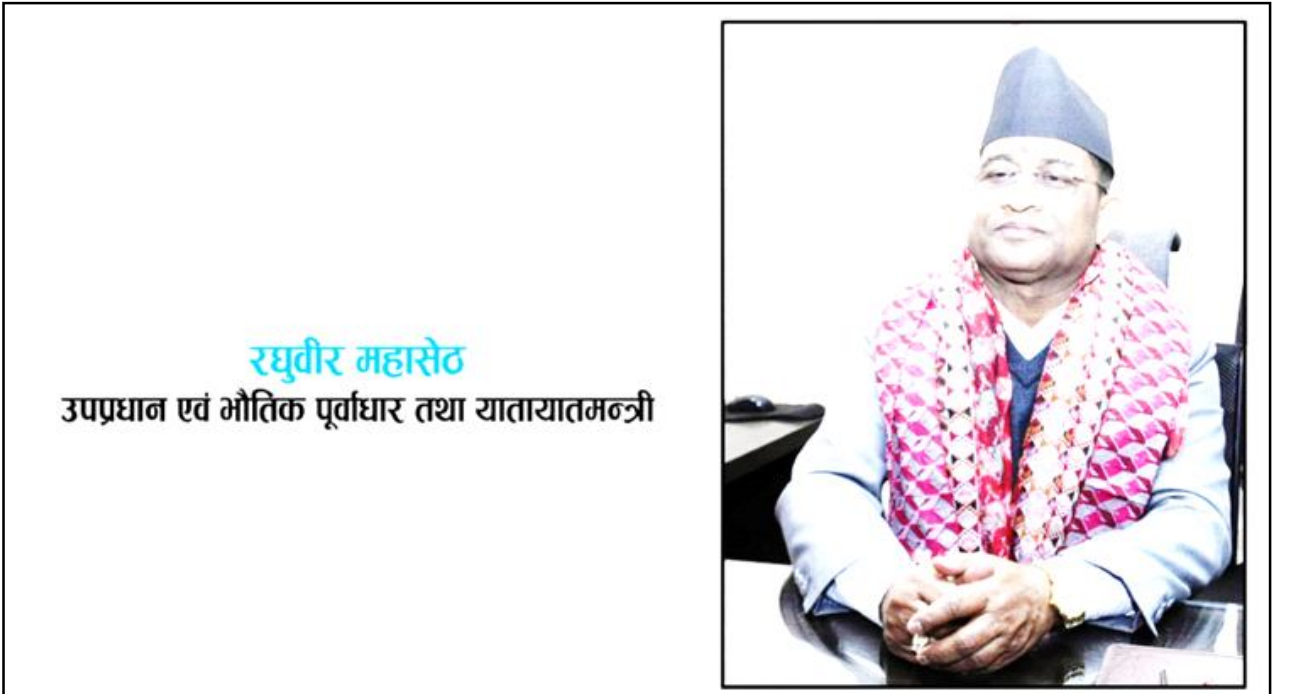
रघुवीर महासेठ उपप्रधान एवं भौतिक पूर्वाधार तथा यातायातमन्त्री

मन्त्रालयका सचिवलगायत कर्मचारीहरूसँग बसेर पनि छलफल गर्ने छु । गौरवका आयोजना कति त सम्पन्न हुने अवस्थामा छन्, कतिमा बजेटको समस्या छ । बजेट कटौतीका कारण पनि त्यस्ता