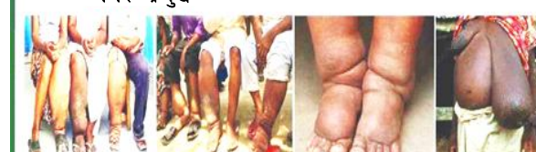
औरही नगरपालिका महोत्तरी

हात्तीपाइले रोगबाट बच्न र बचाउन, यहि मिति २०८१ वैशाख १६ गते देखि हात्तीपाइले विरुद्धको आम औषधी खुवाउने अभियान संचालन हुँदैछ। यस अभियानमा नजिकको स्वास्थ्य संस्था, विद्यालय, कार्यालय तथा आफुलाई पायक पर्ने टोल छिमेकमा गई स्वास्थ्यकर्मीहरूको प्रत्यक्ष निगरानीमा औषधी सेवन गरी हात्तीपाइले रोग निवारण कार्यक्रम सफल पारौं।