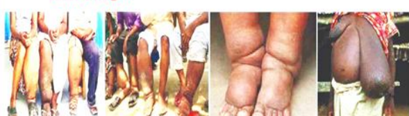
रामगोपालपुर नगरपालिका रामगोपालपुर, महोत्तरी मधेश प्रदेश

हात्तीपाइले रोगबाट बच्न र बचाउन, यहि मिति २०८१ वैशाख १६ गते देखि हात्तीपाइले विरुद्धको आम औषधी खुवाउने अभियान संचालन हुँदैछ। यस अभियानमा नजिकको स्वास्थ्य संस्था, विद्यालय, कार्यालय तथा आफुलाई पायक पर्ने टोल छिमेकमा गई स्वास्थ्यकर्मीहरूको प्रत्यक्ष निगरानीमा औषधी सेवन गरी हात्तीपाइले रोग निवारण कार्यक्रम सफल पारौं।