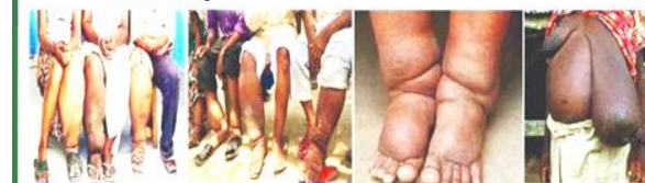
मटिहानी नगरपालिका महोत्तरी

हात्तीपाइले रोगबाट बच्न र बचाउन, यहि मिति २०८१ वैशाख १६ गते देखि हात्तीपाइले विरुद्धको आम औषधी खुवाउने अभियान संचालन हुँदैछ। यस अभियानमा नजिकको स्वास्थ्य संस्था, विद्यालय, कार्यालय तथा आफुलाई पायक पर्ने टोल छिमेकमा गई स्वास्थ्यकर्मीहरूको प्रत्यक्ष निगरानीमा औषधी सेवन गरी हात्तीपाइले रोग निवारण कार्यक्रम सफल पारौं।