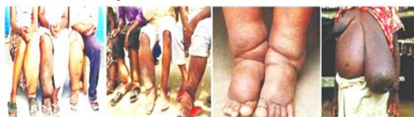
बर्दियास नगरपालिका महोत्तरी

हात्तीपाइले रोगबाट बच्न र बचाउन, यहि मिति २०८१ वैशाख १६ गते देखि हात्तीपाइले विरुद्धको आम औषधी खुवाउने अभियान संचालन हुँदैछ। यस अभियानमा नजिकको स्वास्थ्य संस्था, विद्यालय, कार्यालय तथा आफुलाई पायक पर्ने टोल छिमेकमा गई स्वास्थ्यकर्मीहरूको प्रत्यक्ष निगरानीमा औषधी सेवन गरी हात्तीपाइले रोग निवारण कार्यक्रम सफल पारौं।