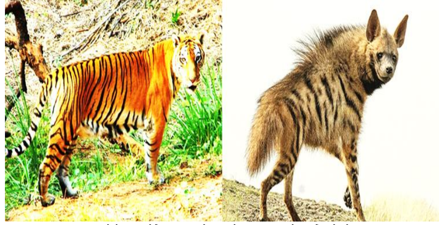
फोटोहरू सांकेतिक हुन् । यो इन्टरनेटबाट डाउनलोड गरिएको हो।

देखिएको जन्तु हुडार हुन सक्ने जिल्ला वन कार्यालयको भनाई