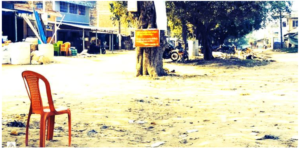
दुहवीस्थित नेपाल-भारत सीमा नाका। यहाँ ‘नो म्यान्सल्यान्ड’मा पनि घरहरू छन्।

आफू दुहवी नबस्ने हुँदा यहाँको नाकाबाट तस्करी हुने वा नहुने आफूलाई जानकारी नभएको