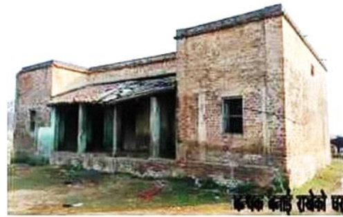
इसको बाई राखेको घर