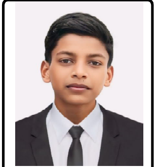
लाइक अन्सारी, सोनामा गाउँपालिका-१, महोत्तरी

देशलाई यहाँ भ्रष्टाचारले गाँजेको छ, पवित्र धर्तीलाई दागले ढाकेको छ। नेतृत्वको पदमा बस्नेले लुट्छन् यहाँ, गरिब जनता भो भन्नु बढी सास्ती पाएको छ। भ्रष्टाचारले सपनाहरूलाई कुचलेको छ, न्यायको बाटोमा बाधाहरू राखेको छ। पर्वतको शिखरमा उज्यालो चम्किरहेको छ, तर देशको माटो अन्धकारमा फसेको छ। आउनुस्, हाम्रो आवाज उठाउं भ्रष्टाचार विरुद्ध, नेपाली आकाशमा फेरि शान्ति ल्याउने समय आएको छ।