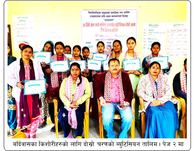
बर्दिवासका किशोरीहरूको लागि दोस्रो चरणको ब्युटिसियन तालिम। पेज २ मा