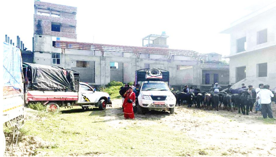
गौशाला नगरपालिका- ५ मा रहेको बजार नगरपालिकाको कृषि उपज केन्द्र सारिएको नयाँ स्थान।

गौशाला नगरपालिका वडा नं ५ मा लाग्दै आएको गोरु, खसी तथा माछा बजारको नामले चिनिने स्थानीय साप्ताहिक हाट बजार नगरपालिका साउन ७ गते निर्णयको निर्णय अनुसार साविकमा लाग्दै आएको स्थानमा बजार लाग्न निषेध गरी गौशाला बजार