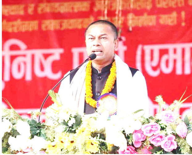
खबर दर्पण समाचारदाता साउन ८ गते, बर्दिया