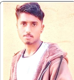
अरविन्द कुमार मण्डल श्री प्रसाद सिंह नमूना माध्यमिक विद्यालय औरही नैनौरी -०२, महोत्तरी

चोट सहेर पनि हाँस, अन्धकारमा पनि बला सूर्य भै बल त सक, अन्धकार आफै टल्छ हीरा बन्न सजिलो छैन, पहिला कोइला बन्नु पछि १०० को तापक्रममा पनि, सुन भै पगिलनु पछि विराट खेल्ने दबावमा, जवाफ दिन्थे रनमा । डिभिलियर्स उड्ये स्वतन्त्र, रच्चे जीवन आफ्नै ढंगमा । साहस गुम्दैन कहिल्यै, आँधी जति नै किन नआओस् । संघर्ष नै साथी हो, जुन हरेक यात्रामा साथ निभाओस् । अवरोधहरू शिक्षा हुन्, हर बाधा पाठ बन्छन् । सपना पूरा गर्नलाई, आँशुको मूल्य तिनै पछि डरलाई जित्नेहरू नै, इतिहास लेख्छन् जमीनमा । काँडाबिच फुल्ने फूल, वाचछ गौरवको बगैचामा । संसार बदल्न पहिले, आफै बदलिनु पछि साँचो संघर्ष त्यही हो, जहाँ मन जित्नु पछि