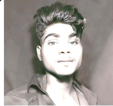
राजु मण्डल श्री प्रसाद सिंह नमूना माध्यमिक विद्यालय औरही नैनौरी -०२, महोत्तरी

समय खराब छै लेकिन नै रखी छि खराब सोच, गलत संगतस दूर भागौला कैली त पदगेलै घुत्नाम मोचा यिहे कलयुग छै, भक्ति नै करैला चाहैछै कोई रोज, कामी, क्रोधी, लालची सब कहैछै भगवानके खोज । स्वार्थ भावस आजकाल, सब पुजैछै भगवान के, भक्तिके व्यापार बनाक आजकाल सब किनैछै भगवान के नै लगैछै तनिको लाज, यी बेशरम इन्सान के, कनैछैथिन भगवान देखके इशानियत यि इन्सान के पुण्यस जाँदा लोकसब करैछै पाप, बच्चा होके कहैछै बरबुजुर्गके हम छियौ तोहार बापा जनमदेके पचताईछै, अपन जन्मदाता, हर्षित रहलिखन पेहले, आव दुःखी छथिन अप्पन धर्ती माता । बहुत निक हावा चलैछै आई यी सहर में, अस्लान करैला चाहिँ छै सब लोभलालचक नहर में सच्चाई बतैला पर लगै छै सबके भुट, देखक अप्पने पछाई, ओके सम्झी छै भुता वित रहलै अन्धकारमें सबक जीवन, कहलास अपनाआपके कोई नै होइछै निमना कहै छि हम त, कोई नै देरहल छै बातके ध्यान, बनाक गुरु अज्ञानीके, लेरहल छै सब ज्ञान ।