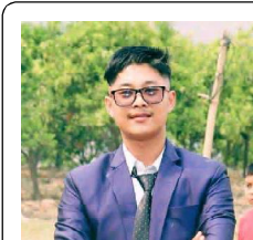
सुजन श्रेष्ठ गौशाला रामनगर -१

आज भोली मलाई अध्यारो रात मन पर्छ । एकतै जुन तारासँग गर्नलाई बात मन पर्छ । तिमी जस्तै स्वार्थीहरूको नजर पर्छ भनेर, अध्यारोमा फुले फूल पारीजात मन पर्छ । फुल टिपेर बोट भाँच्ने नियत गरेपछि तिम्ले, फुल छोडेर तितेपातीको पात मन पर्छ । कुलतमा फसेको छु मुस्किलमा छ जिन्दगी, घोका खाए पछि नसाको मात मन पर्छ । उपहार दिने निउमा पिठ्ठिउमा छुरा हान्यौ, उपहार दिनेहरु भन्दा खाली हात मन पर्छ ।