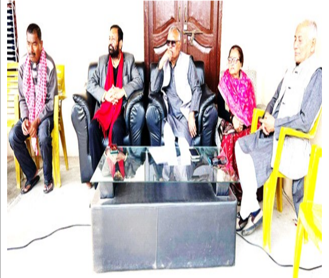
खबर दर्पण समाचारदाता माघ १३ गते, बर्दियास