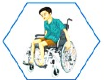
अशक्त / अपाङ्ग

सामाजिक सुरक्षा भत्ता भनेको नेपाल सरकारले लक्षित समूहलाई नियमित रूपमा प्रदान गर्ने आर्थिक सहयोग हो, जसले आधारभूत जीवनयापनमा सहयोग पुऱ्याउँछ। सामाजिक सुरक्षा भत्ता नवीकरणका लागि सम्बन्धित वडा कार्यालयमा साउन १ देखि भदौ मसान्तभित्र परिचयपत्र सहित उपस्थित भई तोकिएको समय मै नाम नवीकरण गर्न सूचित गरिन्छ।