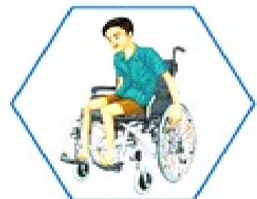
अशक्त / अपाङ्ग

सामाजिक सुरक्षा भत्ता भनेको नेपाल सरकारले लक्षित समूहलाई नियमित रूपमा प्रदान गर्ने आर्थिक सहयोग हो, जसले आधारभूत जीवनयापनमा सहयोग पुऱ्याउँछ। सामाजिक सुरक्षा भत्ता नवीकरणका लागि सम्बन्धित वडा कार्यालयमा साउन १ देखि भदौ मसान्तभित्र परिचयपत्र सहित उपस्थित भई तोकिएको समय मै नाम नवीकरण गर्न सूचित गरिन्छ।