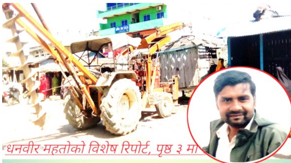
धनवीर महतोको विशेष रिपोर्ट, पृष्ठ ३ मा

महोत्तरी जिल्लाकै प्रमुख व्यापारिक केन्द्र गौशाला नगर पालिका स्थित गौशालाबजारमा सार्वजनिक जग्गा अतिक्रमणमुक्त गर्ने अभियान अब बडा अध्यक्षको नेतृत्वमा पुनः सञ्चालन हुने भएको छ। आइतबार गौशाला नगर पालिकाको कार्यालयमा बसेको सर्वपक्षीय बैठकले यस्तो निर्णय गर्दै शनिवार देखि बन्द रहेको बजार समेत खुल्ला भएको छ। जिल्लाकै प्रमुख व्यापारी केन्द्र गौशालाबजारको सार्वजनिक जग्गा अतिक्रमणमुक्तको अभियान अबदेखि बडाअध्यक्षको नेतृत्वमा संचालन हुने भएको छ। आइतबार गौशाला नगर पालिकाको कार्यालयमा बसेको