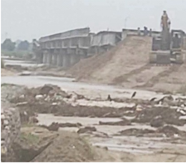
खबर दर्पण समाचारदाता असार ७ गते, बर्दिया

सिरहा र धनुषा जिल्लालाई जोड्ने कमला नदीस्थित अस्थायी डाइभर्सन आज विहानदेखि पूर्ण रूपमा बन्द भएको छ। गएरातिको वर्षापछि डाइभर्सनको ठूलो भाग थप भासिएपछि विहानदेखि सवारी साधनको आवागमन ठप्प भएको हो। सिरहाको बसविट्टा क्षेत्रतर्फ निर्माण गरिएको करिब एक करोड २५ लाख रुपैयाँ लागतको तारजाली र माटोयुक्त अस्थायी डाइभर्सन केही महिनाअघि मात्रै सञ्चालनमा ल्याइएको थियो। तर, निरन्तरको वर्षा र कमला नदीको बहाव बढेसँगै संरचना कमजोर भई आज विहानदेखि पूर्ण रूपमा प्रयोगविहीन बनेको स्थानीयले बताएका छन्। स्थानीयवासीका अनुसार विहानै देखि सवारीसाधन डाइभर्सन पार गर्न नसक्ने भएपछि सिरहा-धनुषा आवागमन पूर्ण रूपमा प्रभावित भएको छ। केही मोटरसाइकल चालकले