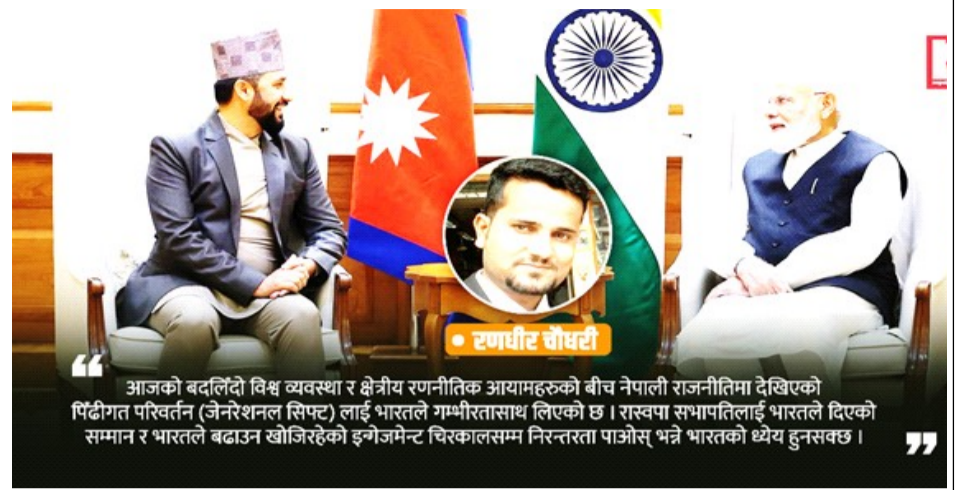
आजको बदलिँदो विश्व व्यवस्था र क्षेत्रीय रणनीतिक आयामहरूको बीच नेपाली राजनीतिमा देखिएको पिँढीगत परिवर्तन (जेनेरेशनल सिफ्ट) लाई भारतले गम्भीरतासाथ लिएको छ। रास्वपा सभापतिलाई भारतले दिएको सम्मान र भारतले बढाउन खोजिरहेको इन्जेमेन्ट चिरकालसम्म निरन्तरता पाओस् भन्ने भारतको ध्येय हुनसक्छ।

सन् १९४७ विश्व राजनीतिमा एउटा विशेष वर्ष थियो। यही वर्ष