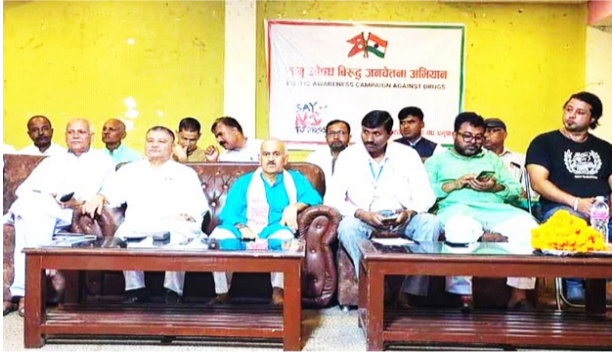
खबर दर्पण समाचारदाता जेठ २४ गते, जनकपुरधाम